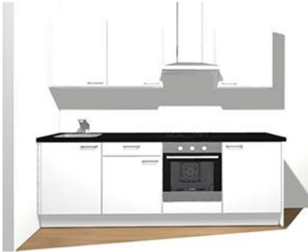
Voorstel keukenopstelling De Witte Kroon