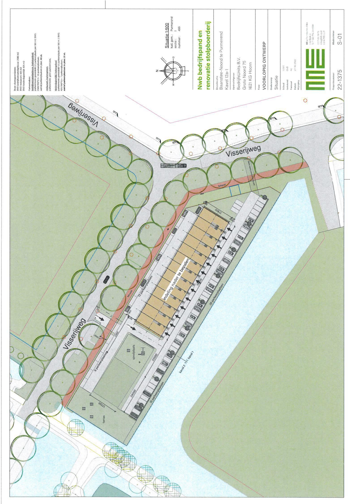
Pand: De Broedplaats, Visserijweg 61-02, 1446 AR Purmerend, Baansteer Noord

Deze informatie is vrijblijvend. Omtrent gegevens en bevindingen wordt geen aansprakelijkheid aanvaard.